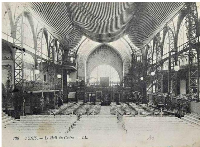
Figure 1: Le palmarium du casino-théâtre de Tunis

Le reste de la vie de Bibiano Duclos est très mal connu. Son départ pour la Tunisie fait peut-être suite à une faillite à Paris ; peut-être aussi a-t-il voulu suivre de près les travaux de construction du casino-théâtre de Tunis sur lequel il est intervenu [1]. A côté d'une activité de chef d'entreprise [2], il occupe à Tunis toute une série de postes honorifiques : il est président de sociétés de gymnastique dès 1901, président de sociétés d'enseignement, président de la fédération des cercles tunisiens, représentant de la communauté française à la Conférence Consultative de la Tunisie (élu en 1905, 1907 [3]), etc.